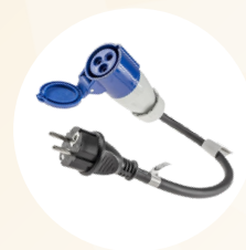
Adaptateur P17 vers prise standard