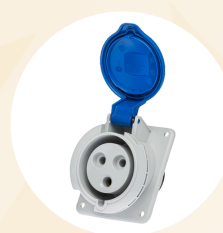
Branchement Prise P17 - 32A - 20V - Monophasée