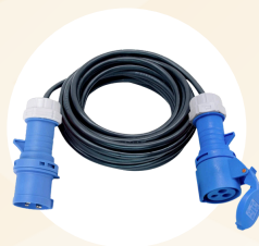
Rallonge P17 (10 mètres)