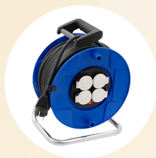
Enrouleur IP44 (25 mètres)