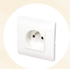
Branchement Prise standard (3,5W)