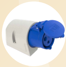
Sortie du camion Prise P17 - 32A - 20V - Monophasée